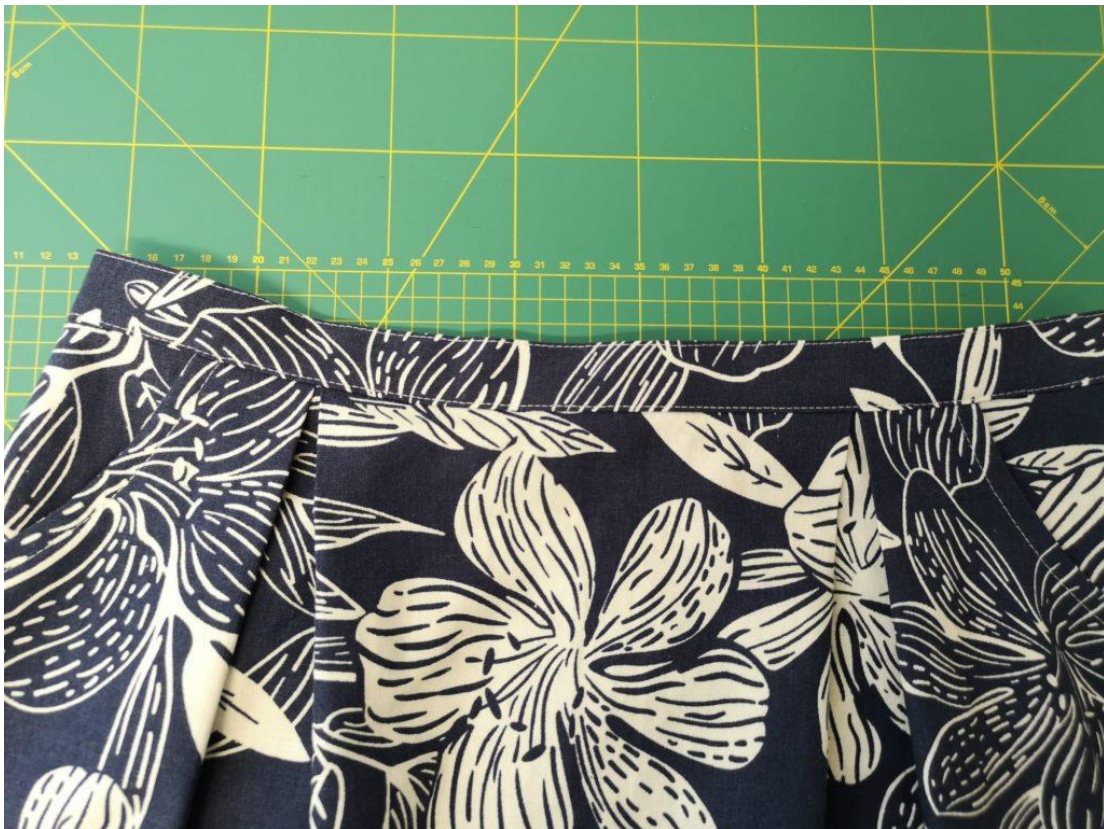
49. Celý pásek o obvodu prošijeme a tím i upevníme zastehovanou část pásku.