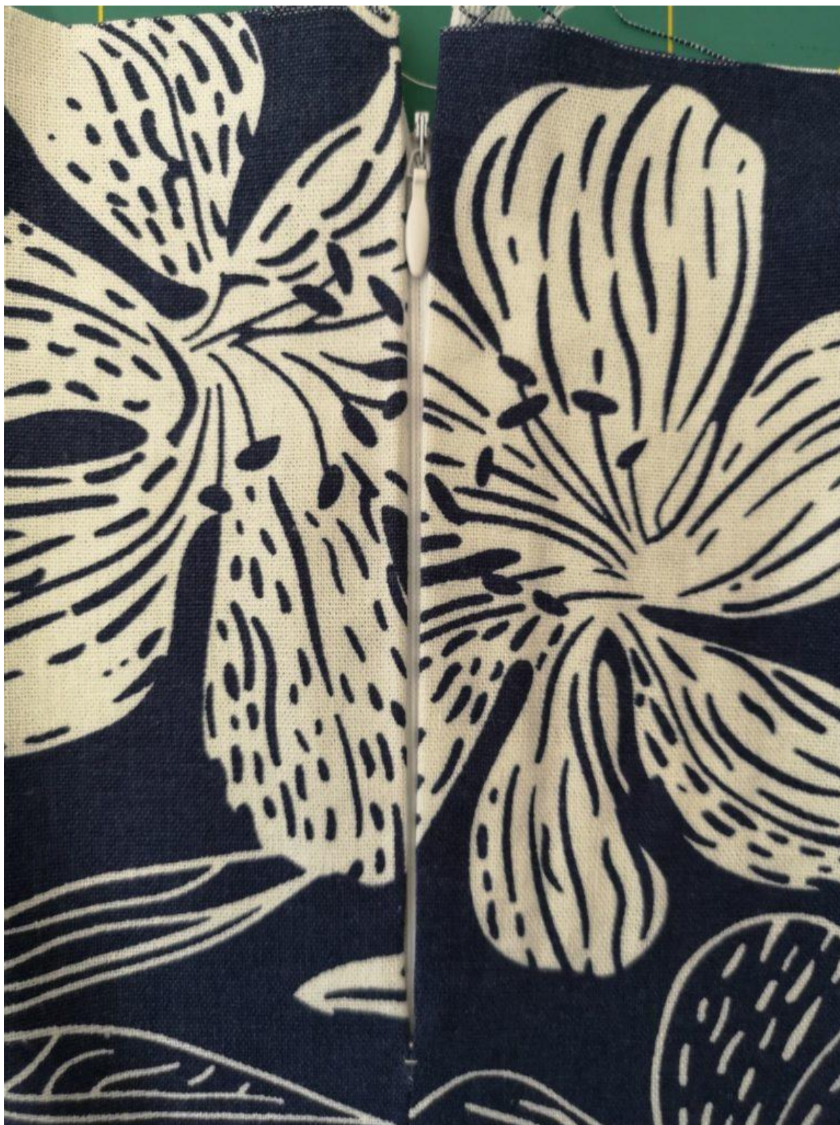
13. Našitý zip z LS