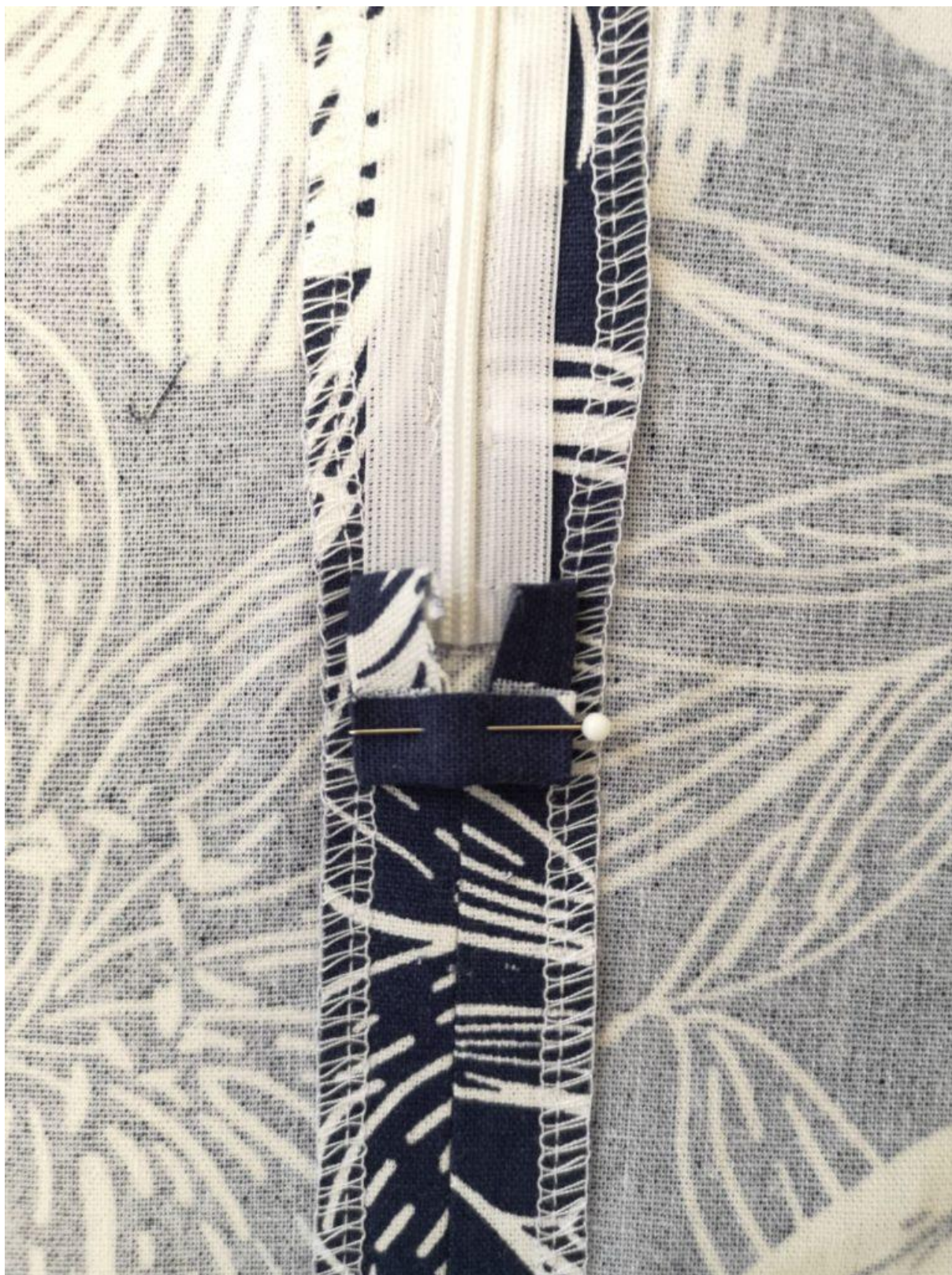
18. Dolní část obdélníčku zahněte 1 cm dle fotky