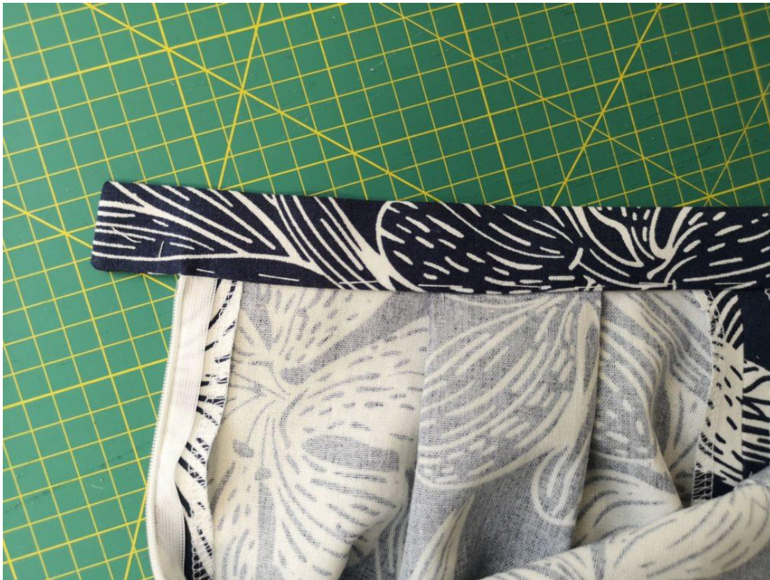
48. Detail nastehování