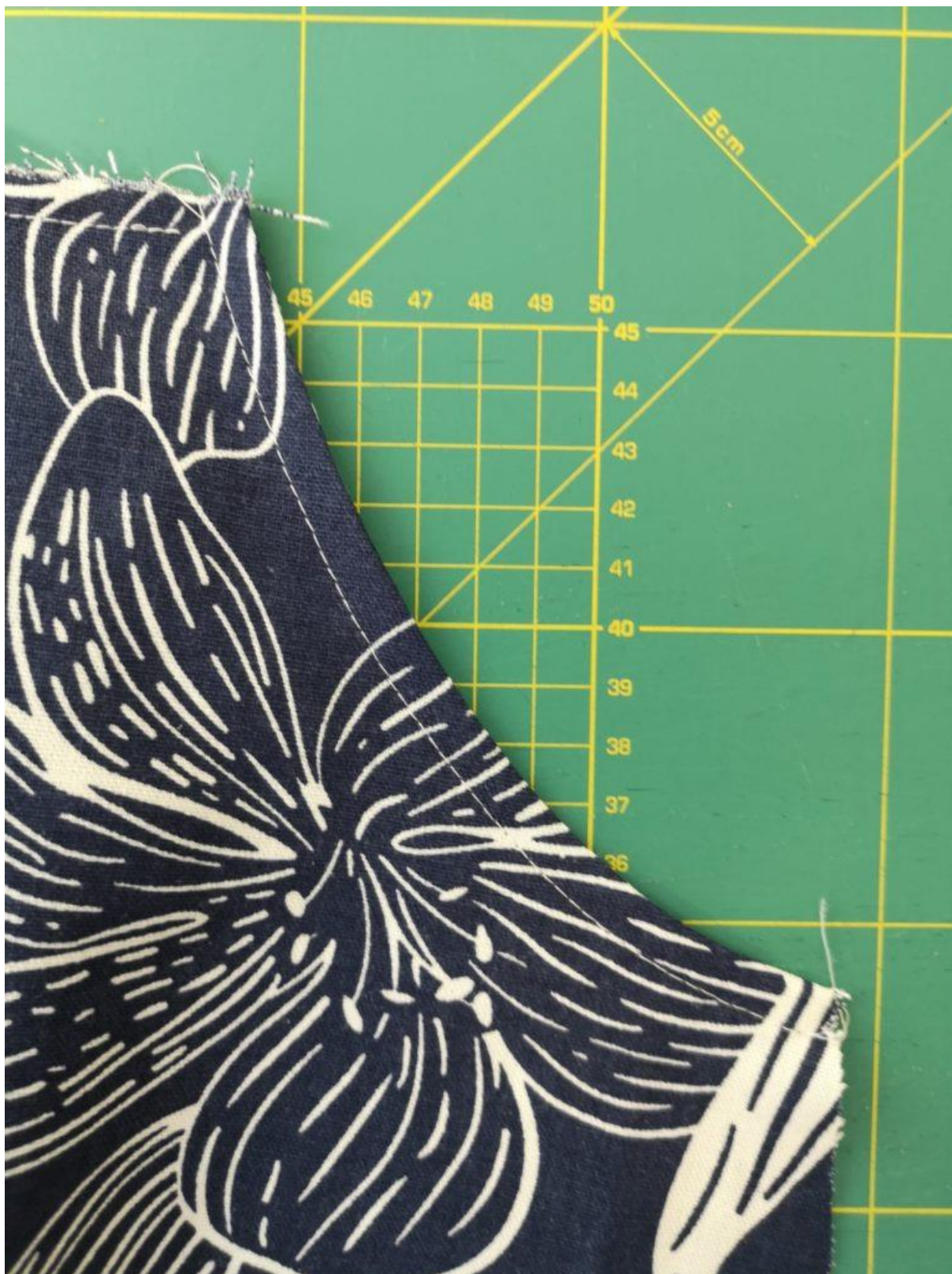
27. Z LS prošijeme za patku kapsový otvor.