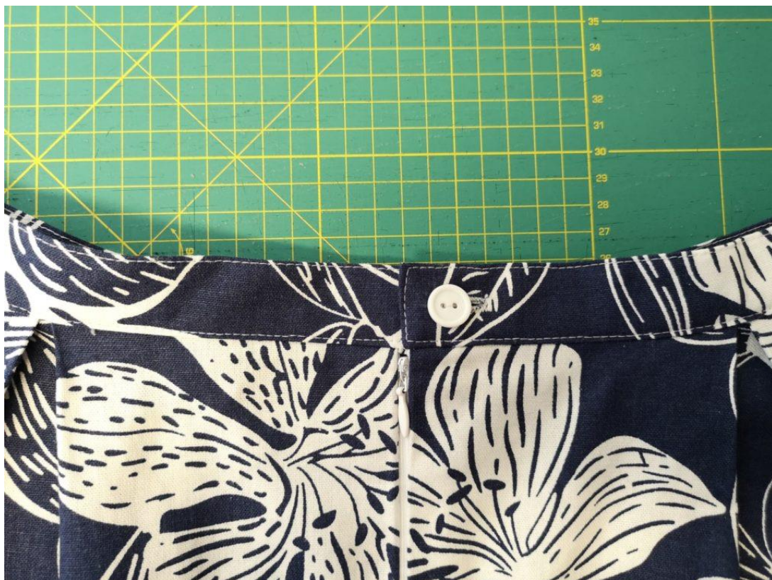
53. Našijeme knoflík