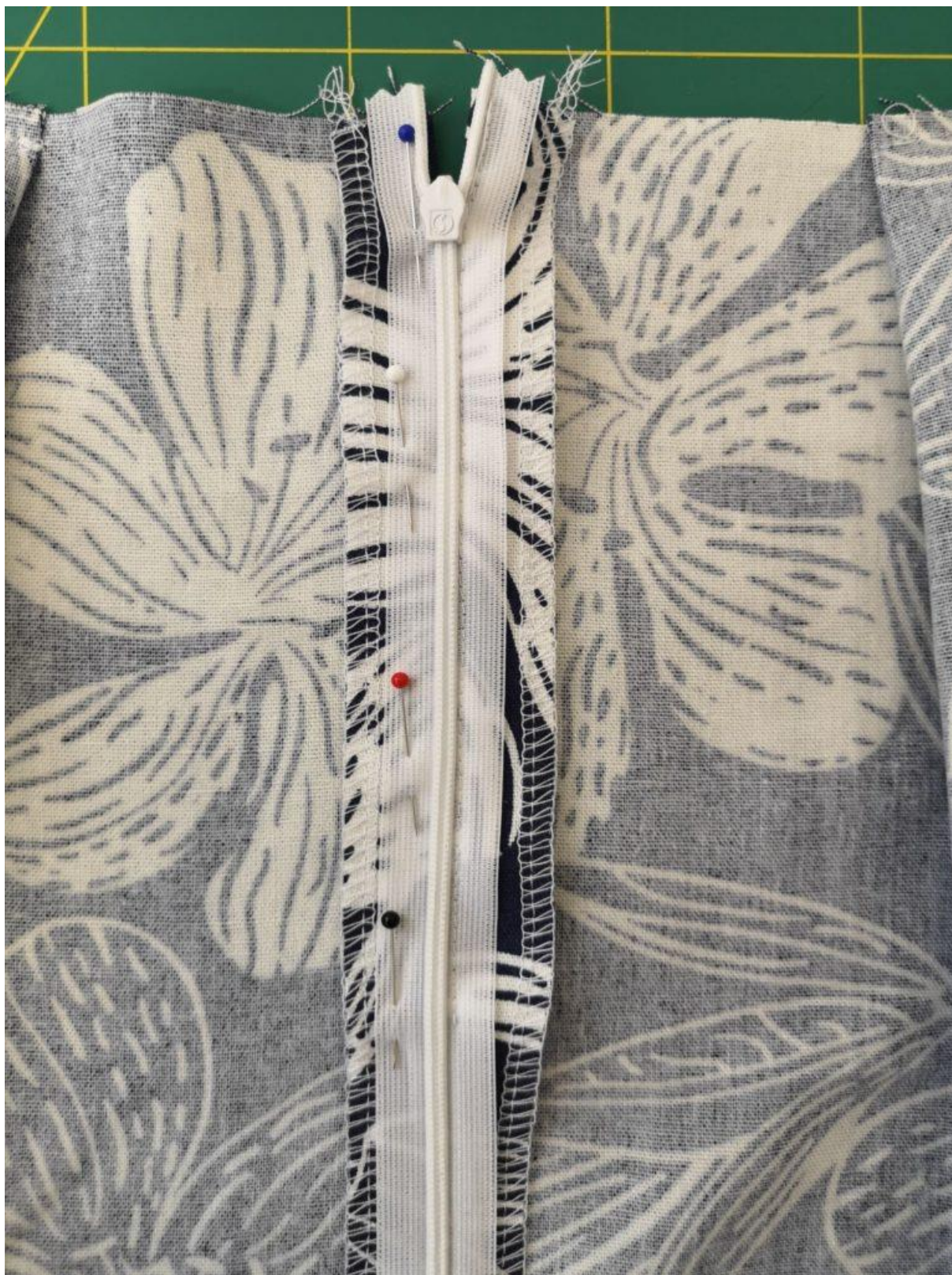
11. Druhou tkanici zipu našpendlíme stejným způsobem na druhou část ZD