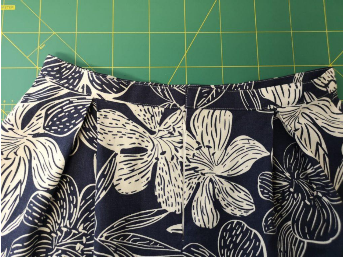
50. Detail na prošití na ZD.