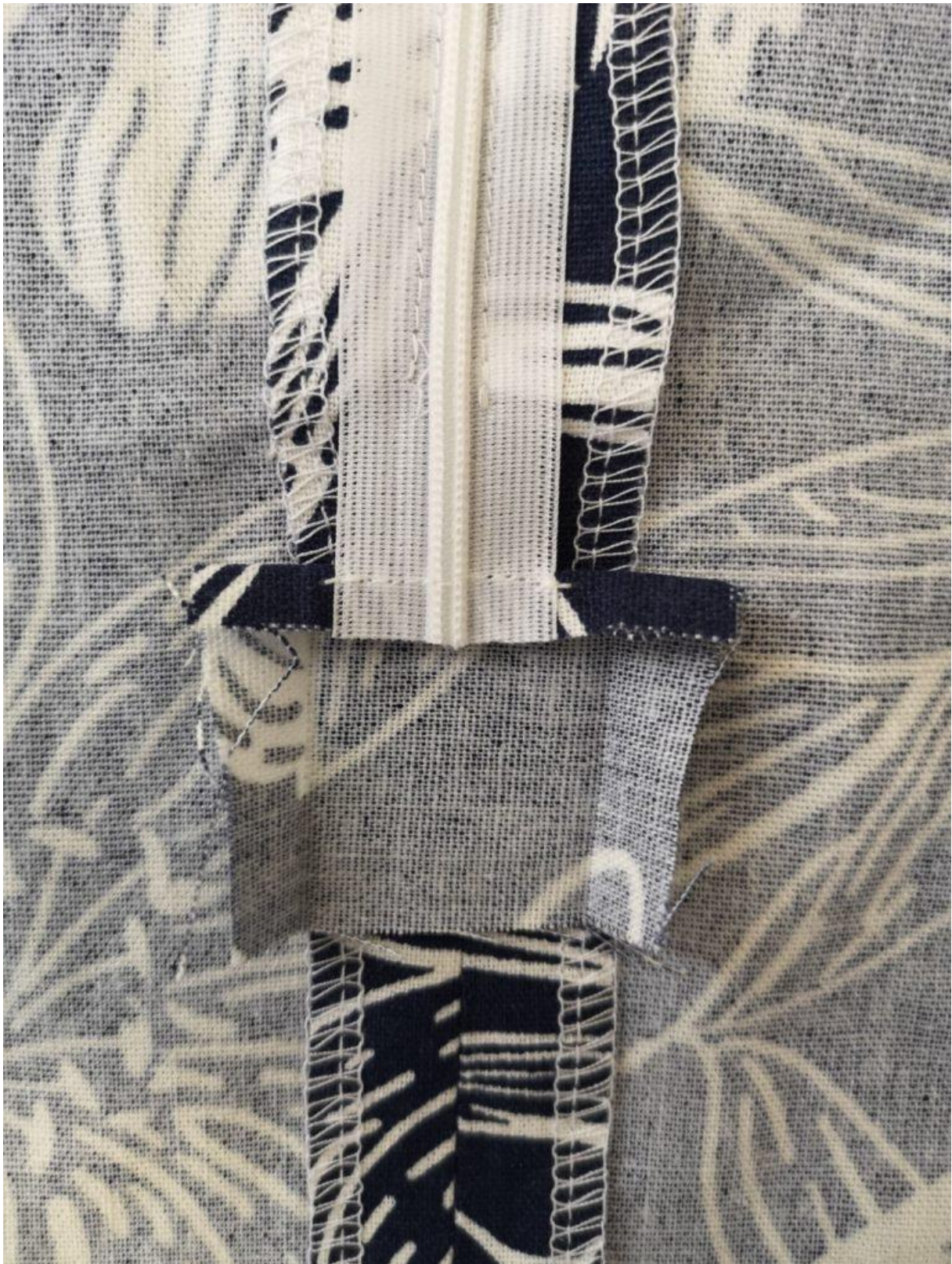
16. Na tkanici dle fotky našijte obdélníček materiálu