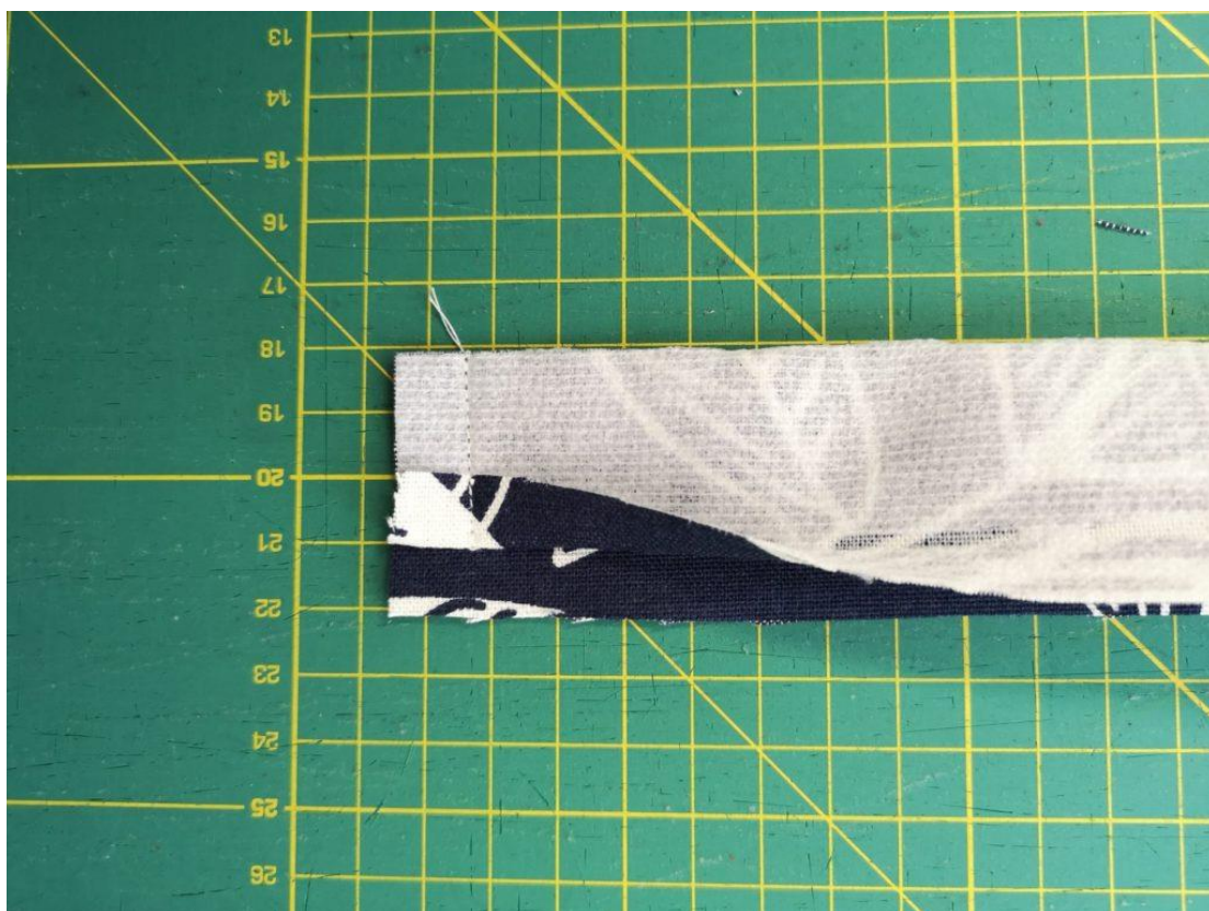
40. Přes šíři pásku sešijeme 1cm od kraje.