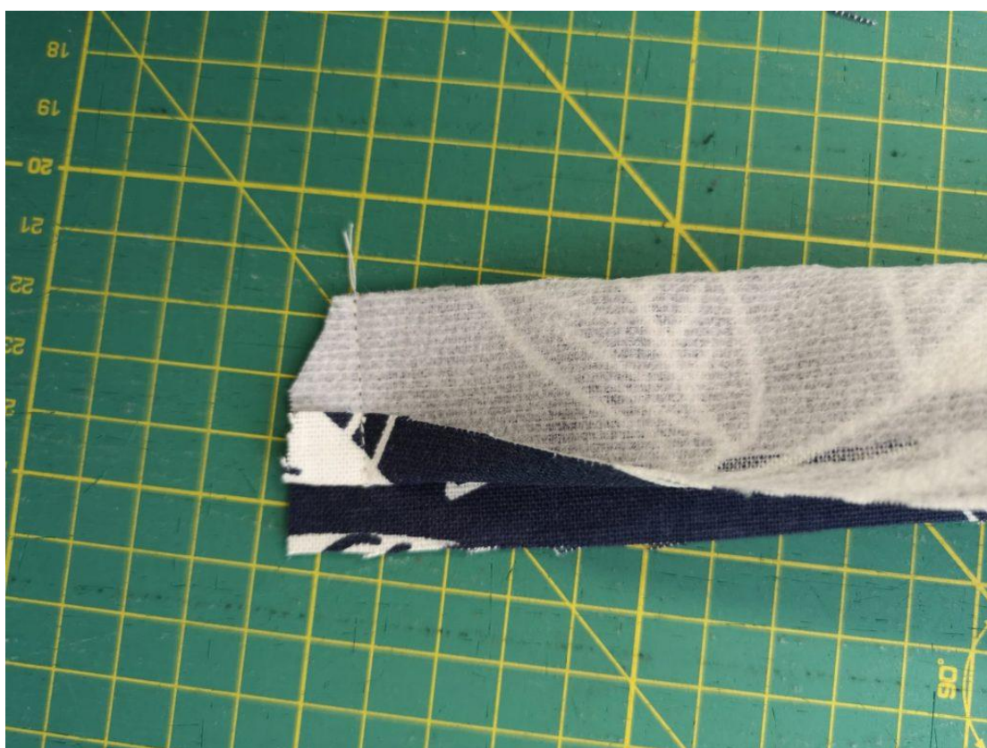
41. Sestříhneme rožek.