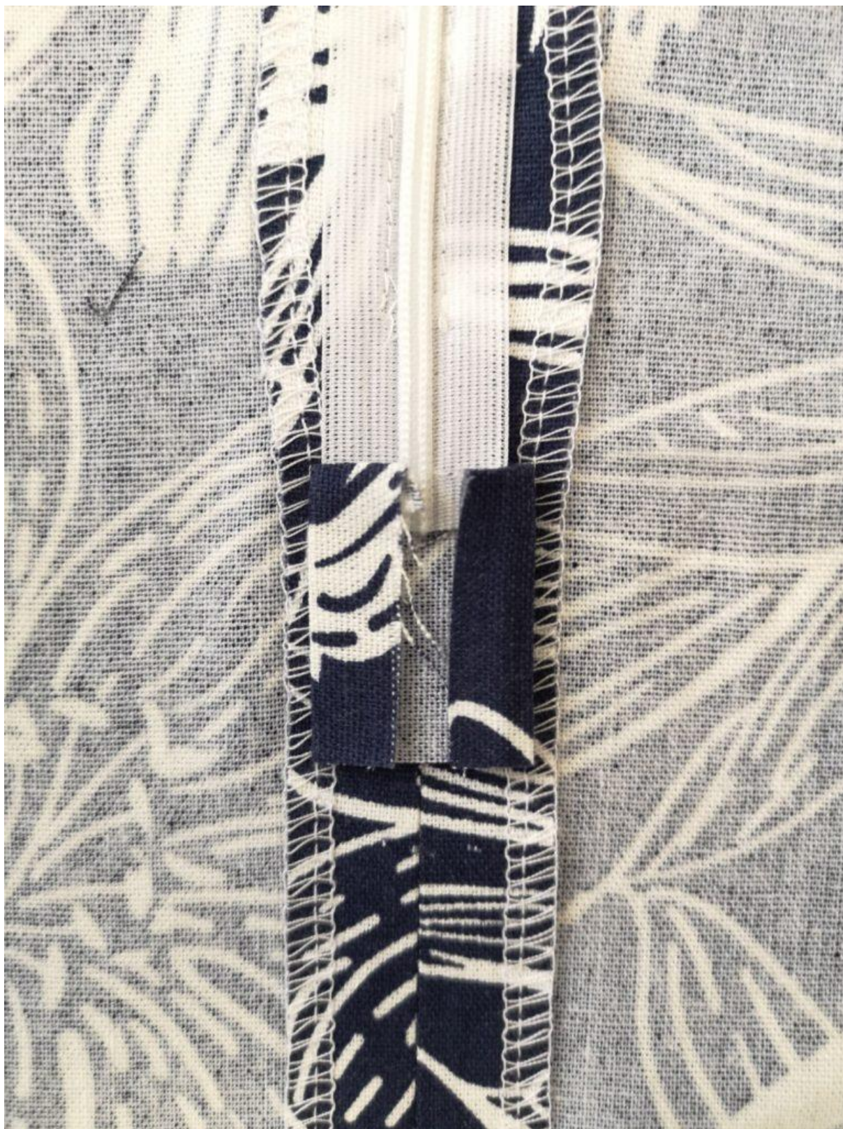
17. Strany obdélíčku zahněte na šíři tkanice