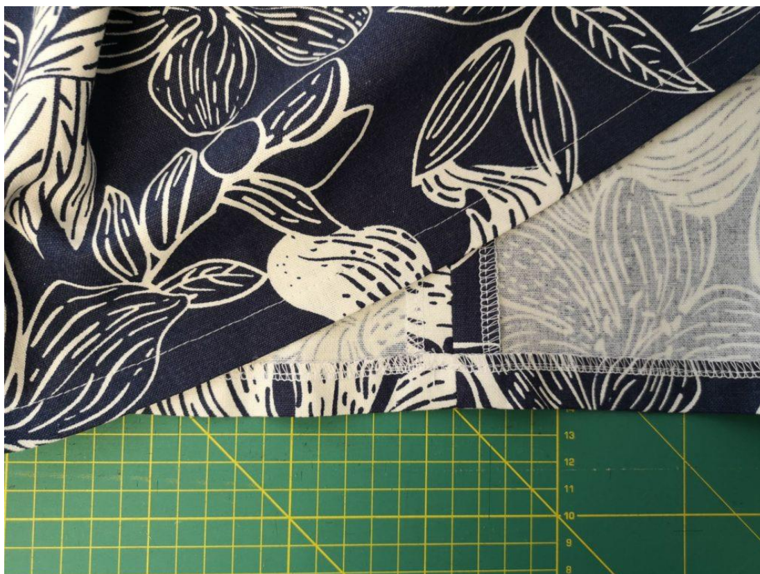
54. Dolní kraj sukně začistíme overlockem a zahneme 2cm do RS a z LS prošijeme za 1,5cm od kraje.