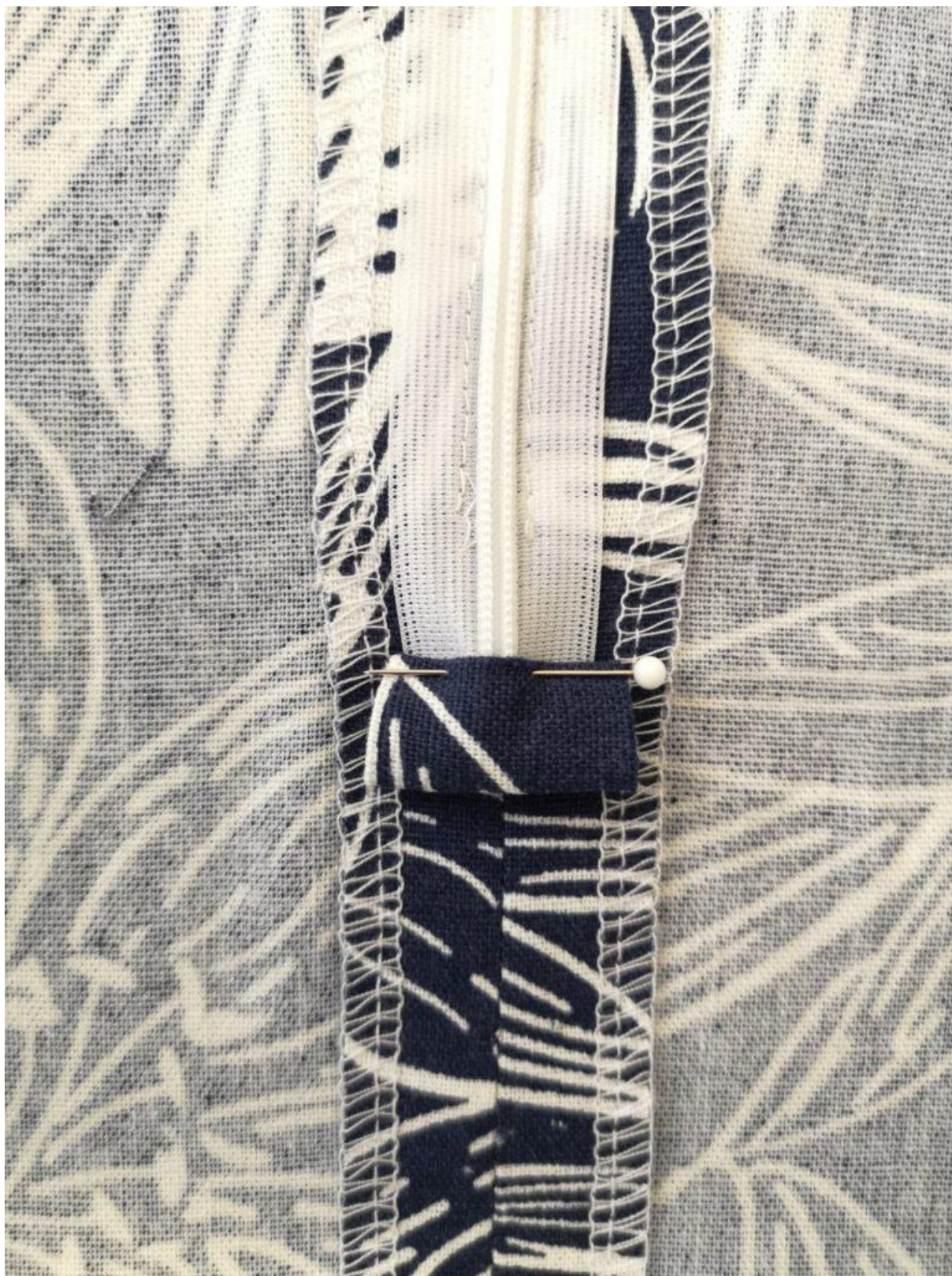
19. A ještě jednou zahněte tak, aby se lehce zakrylo našitý obdélníčku