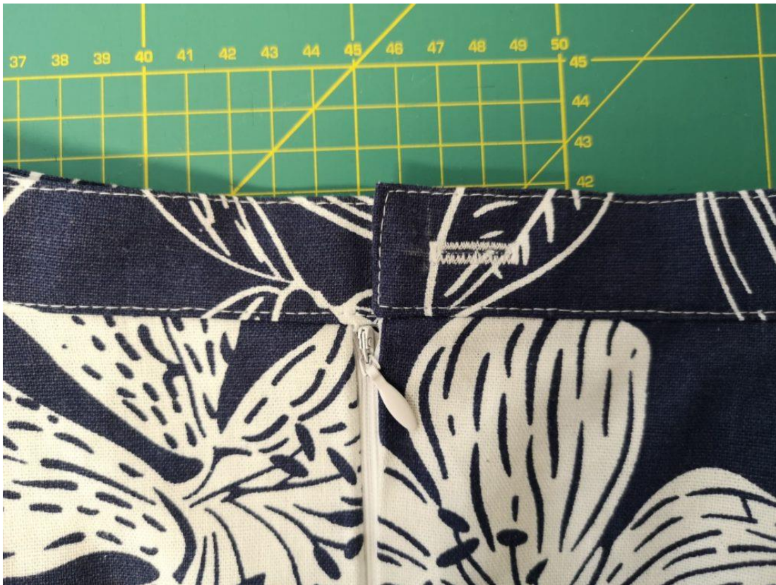
51. Na ZD si na pásku vypracujeme knoflíkovou díрку cca 1,5-2cm od kraje.