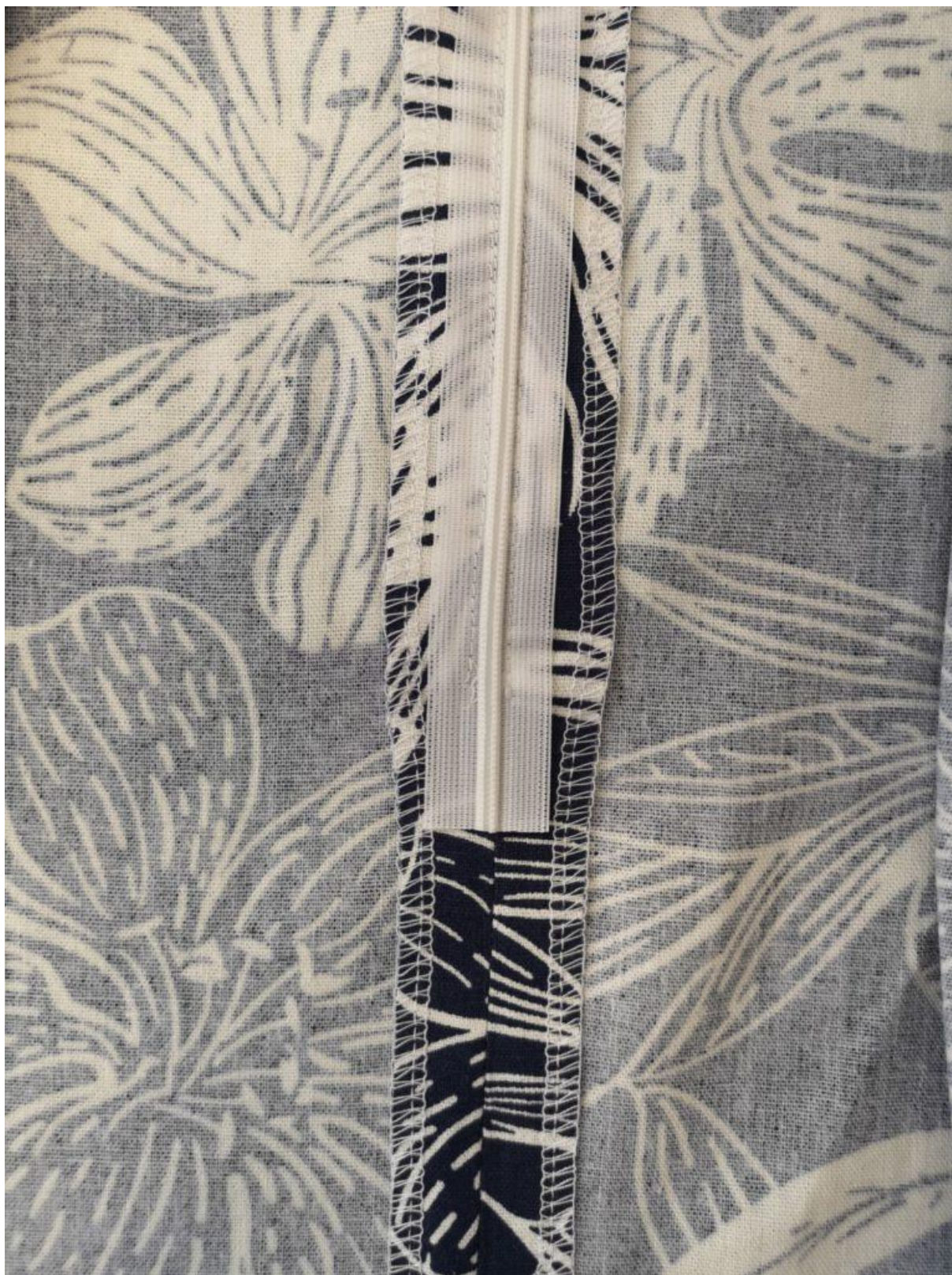
15. Zipovou tkanici ustříhnete cca 3 cm pod koncem zipového rozparku